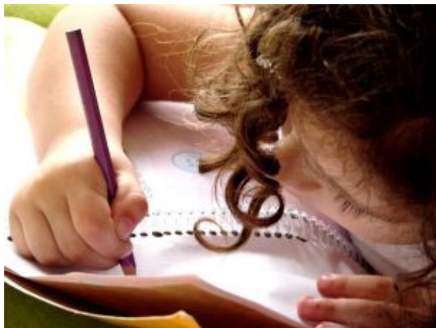
Enfant faisant ses devoirs